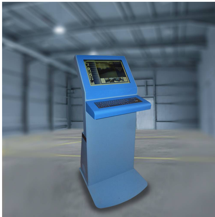
Информационный цеховой терминал (ИЦТ)