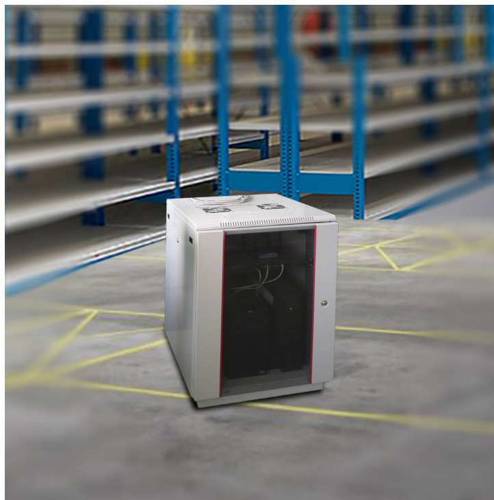
Сервер цеховой системы

Допустимая температура окружающего воздуха – от +10 до +35°C.